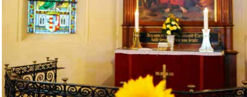
Alteret med solsikke i Langesø Skovkapel.