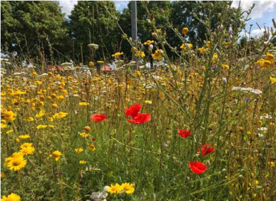
Den fynske natur er mangfoldig, og mange steder kan du opleve, at de vilde blomster får lov til at formere sig, til stor glæde for insekterne.

skræmsel, og andre dyrelyd, samt vandets roligt rullende tempo. Ved flere af shelterne er der lavet bålplads, toiletforhold og enkelte sågar med mulighed for at tage brusebad, hvis havet i sig selv ikke er nok.