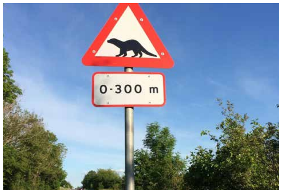
Her er endnu et tegn på, at dyrelivet er rigt repræsenteret i Nordfyns Kommune. Tag selv på udflugt og oplev en bæver ved et af kommunens mange vedligeholdte, men også naturlige vandløb.

Så jeg har bare tilbage at sige: rigtig god læse- og kiggelyst.