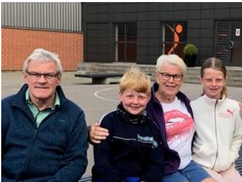
Aktiv ferie på BGI idrætsefterskole med de store børnebørn